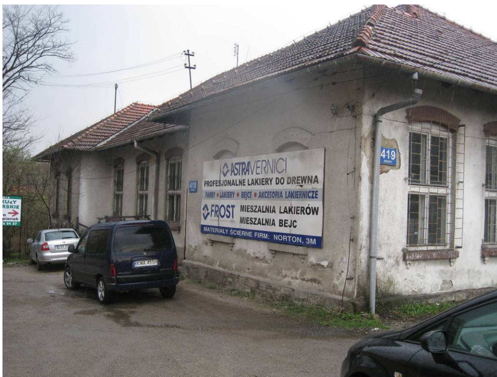
Budynek „starej szkoły”