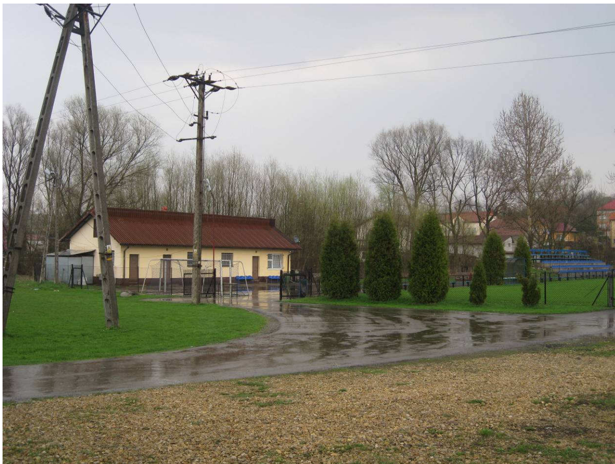
Obiekty sportowe LKS „Cedron” Brody