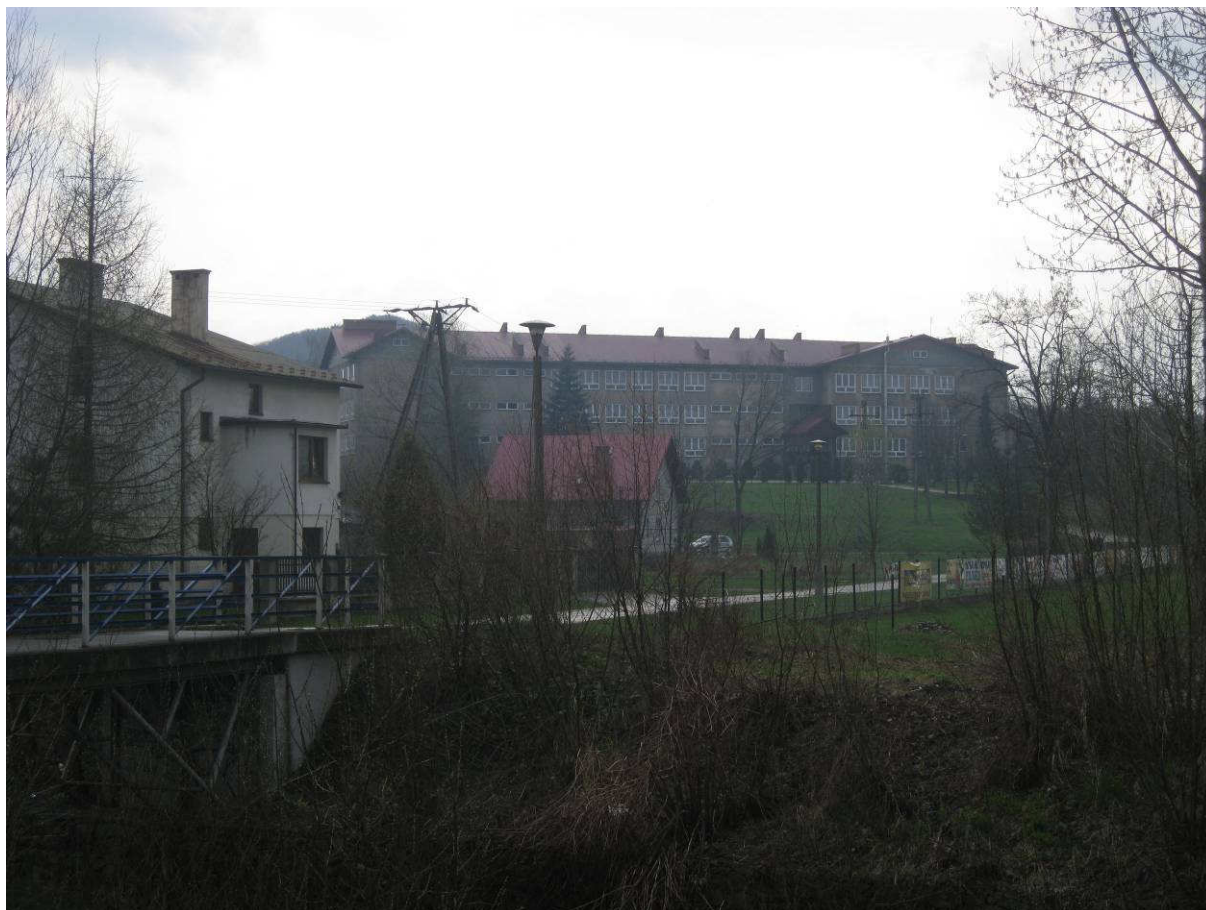
Zespół Szkół nr 2 w Brodach