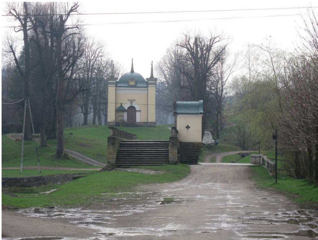
Brama Wschodnia, most i kapliczka „Na Cedronie”