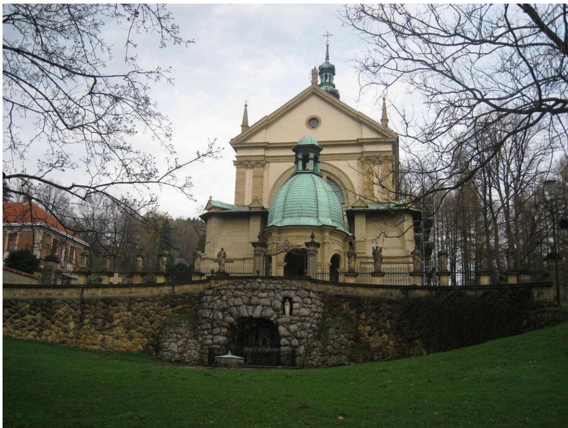
Kościół Wniebowzięcia Najświętszej Maryi Panny, grota Matki Boskiej z Lourdes