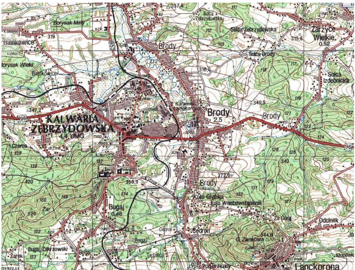
Mapa położenia miejscowości Brody

Odległość od Kalwarii Zebrzydowskiej wynosi ok. 2 km, od Skawiny ok. 22 km, od Wadowic ok. 16 km i od Krakowa 34 km.