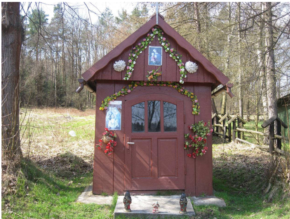
Kapliczka Brody Solca